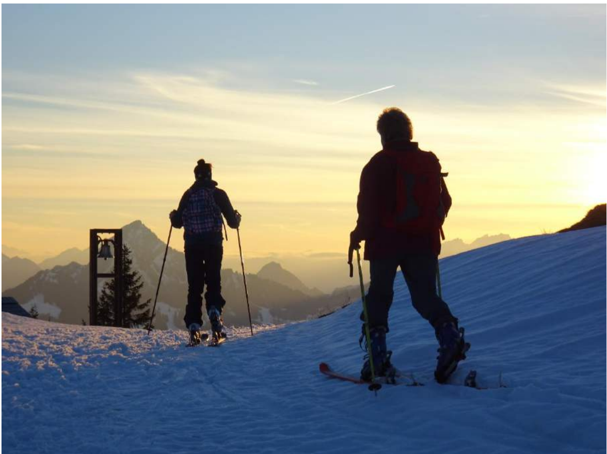
Im letzten Abendlicht bei der Haggenegg