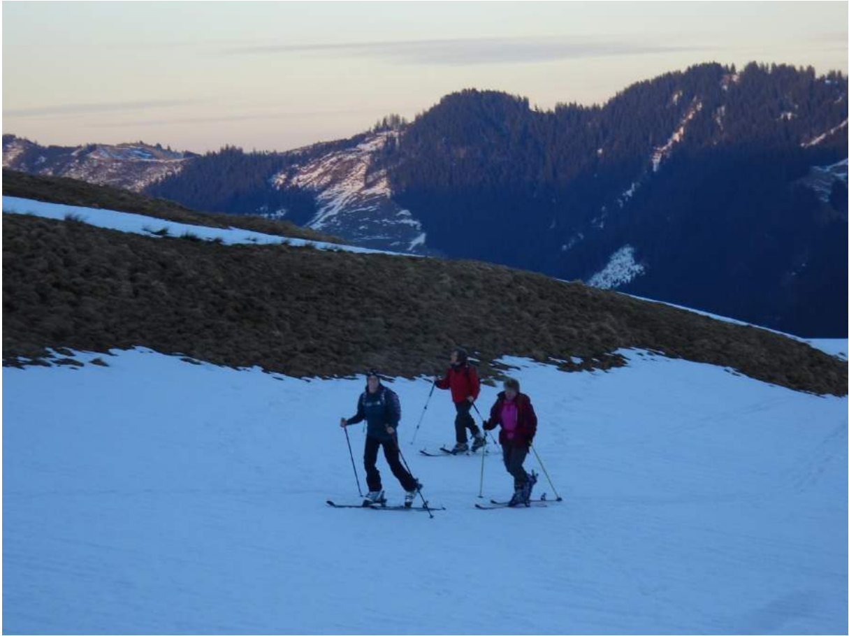
Bei der Alp Gummen