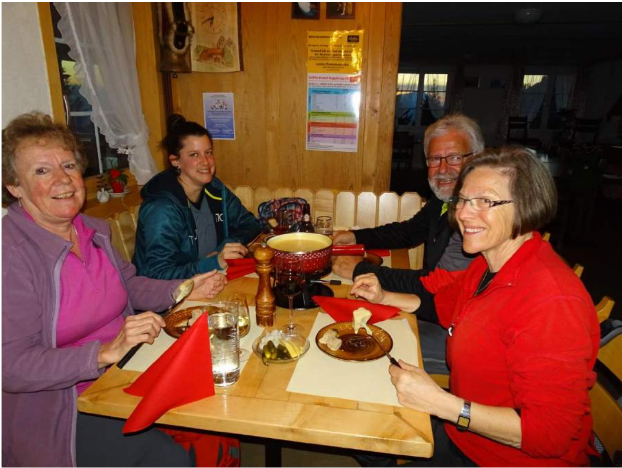
Nachtessen im Alprestaurant Haggenegg