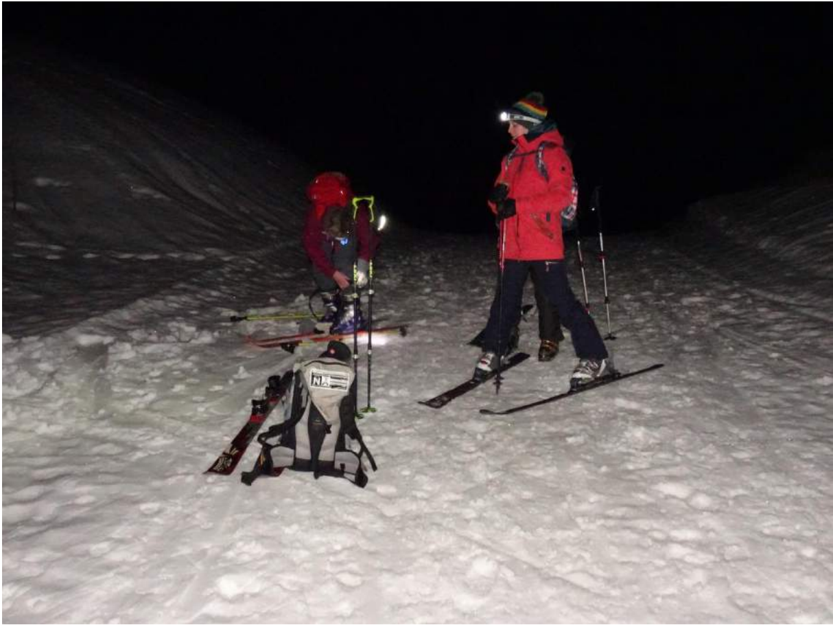
Bereitmachen zur Abfahrt