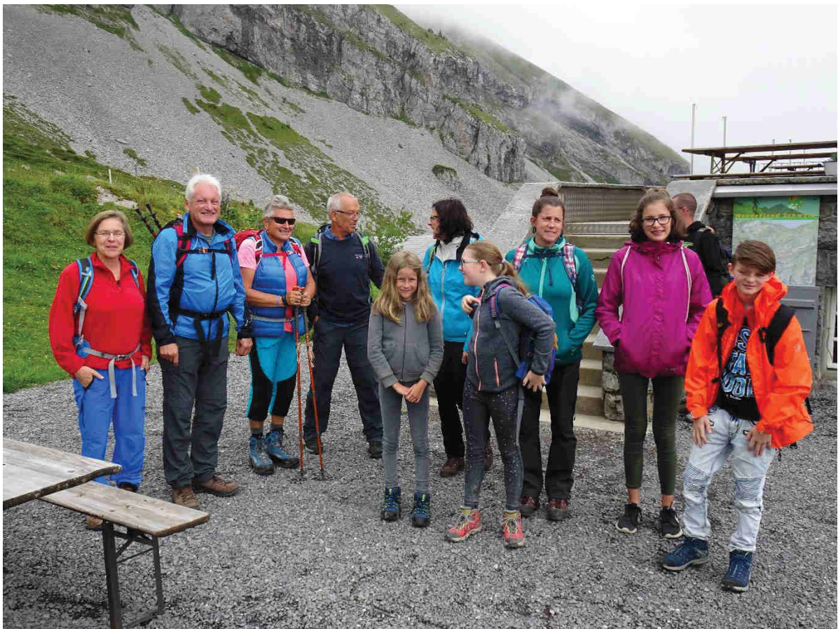
Eine tolle Gruppe