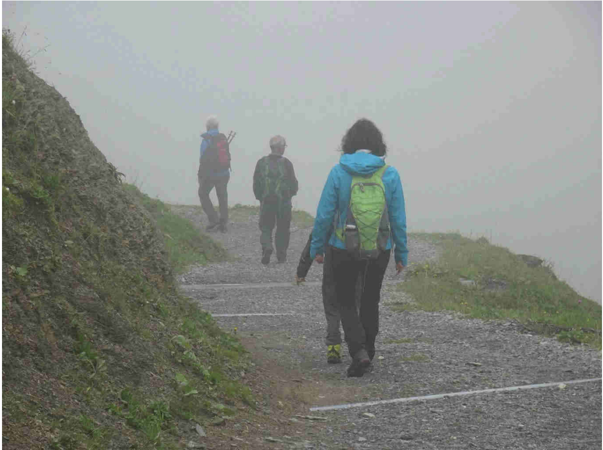
Abstieg vom Satteli Richtung Büel