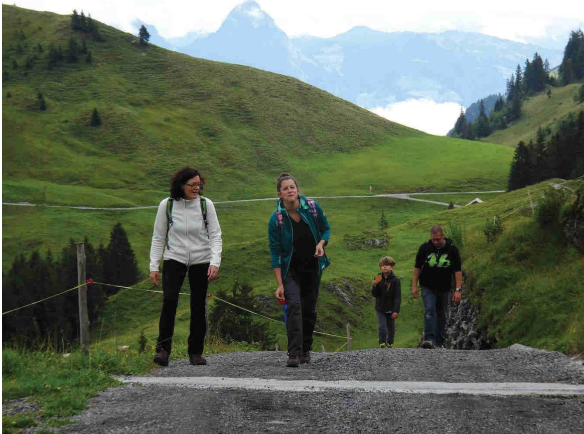
Im Aufstieg oberhalb Stafel mit Mythen