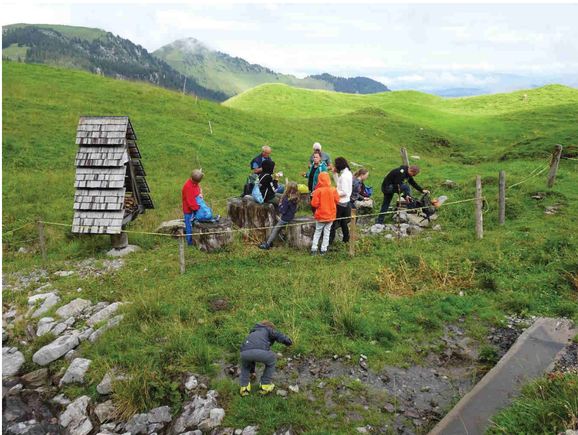
Rast bei der Oberen Büelhütte